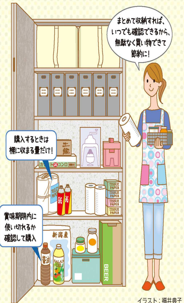
イラスト：福井典子

大切なのは、「収納場所を決めて、何がいくつあるのか常に明確にする」「期限内に使い切れる量だけ購入する」こと。これを意識すれば無駄な買い物が減り、使い切れずに余らせてしまうこともなくなります。無駄をなくすことが、節約につながるポイントなのです。