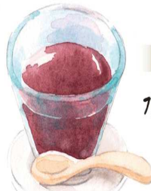
季節の和菓子 水ようかん