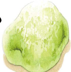
季節の和菓子 うぐいす餅