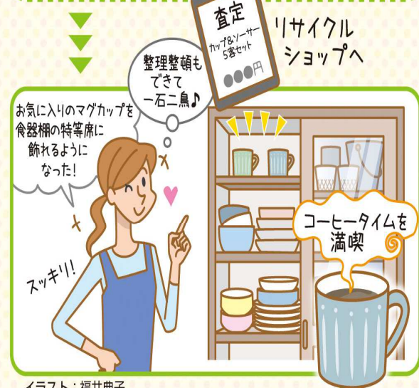
イラスト：福井典子