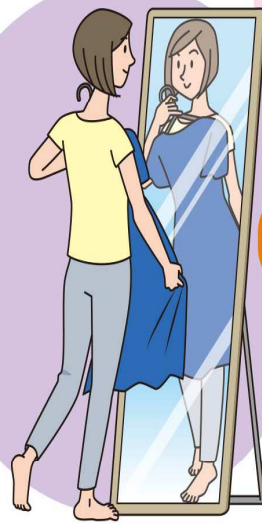
イラスト: 福井典子